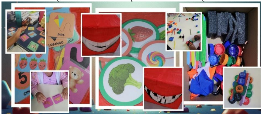
Fotografia 1 – Recursos lúdicos para o desenvolvimento cognitivo

Dentre as atividades desenvolvidas nessa perspectiva, destacamos, como exemplo, os jogos de pareamento, o jogo “Tlim ou Toim-oin-oin?” e as “Caixas criativas”, as quais descrevemos a seguir (fotografia 1).