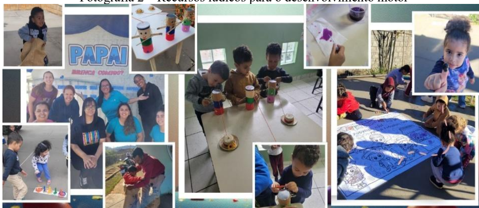
Fotografia 2 – Recursos lúdicos para o desenvolvimento motor

Nesse sentido, desenvolvemos atividades lúdicas variadas que proporcionaram às crianças a exploração de diferentes movimentos, permitindo que as crianças experimentassem e exercitassem diversas capacidades corporais. (fotografia 2)