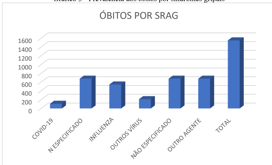
Gráfico 3 - Prevalência dos óbitos por síndromes gripais

Esse achado evidencia que a gravidade clínica dos casos internados reflete tanto a complexidade da doença quanto possíveis atrasos no diagnóstico e no início do tratamento, fatores que podem impactar negativamente o prognóstico. Além disso, a presença de comorbidades pré-existentes, o avançar da idade e a limitação do suporte respiratório em determinados contextos assistenciais também se configuram como elementos que potencializam o risco de óbito entre os pacientes internados por SRAG. Observar gráfico 3: